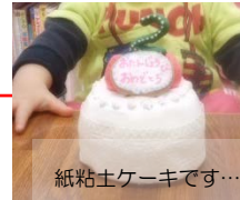
紙粘土ケーキです…